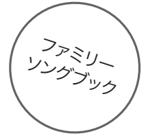
イラスト ジェイミー・キム ジェラルド・ケリー